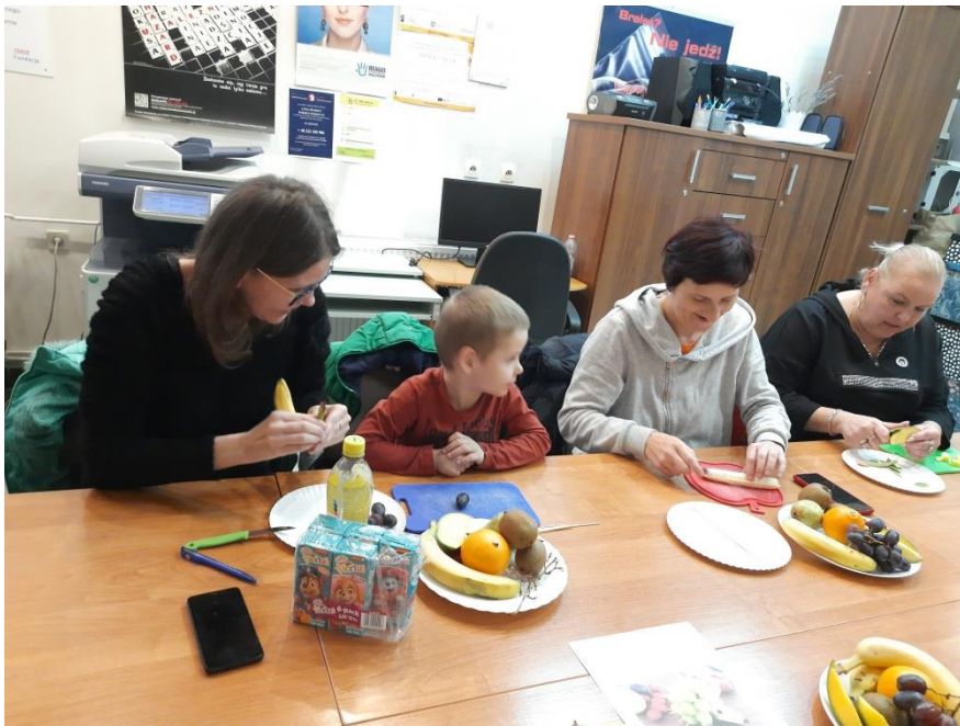
Spotkanie edukacyjno – terapeutyczne „Zdrowie na talerzu”