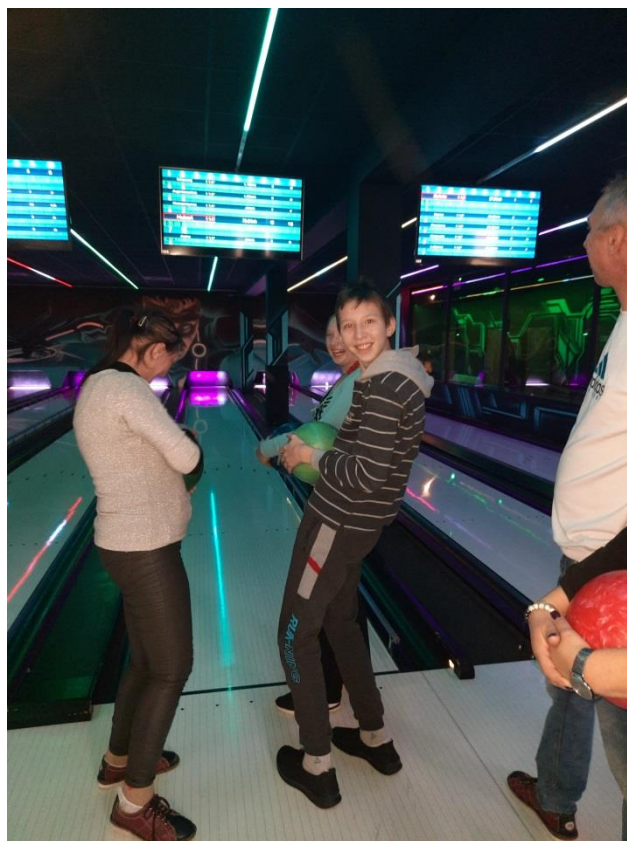
Terapeutyczny wyjazd integracyjny