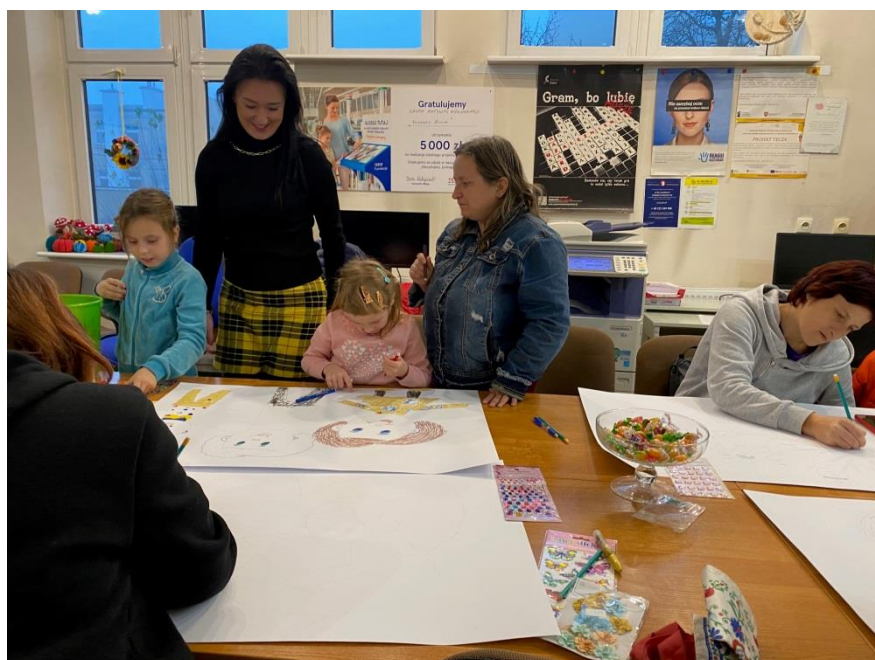
Spotkanie edukacyjno – terapeutyczne „Profilaktyczne zajęcia kreatywne”